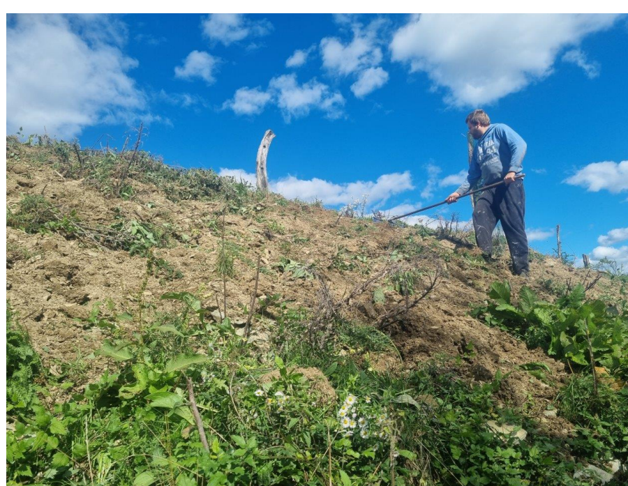
Trosenje izbrane semenske mešanice na delno kultivirano površino in zadelava v tla (primer iz Tolminskega Loma)