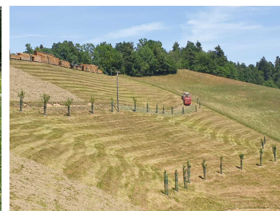
Na obstoječe travnike potrosen zeleni odkos iz donorskih površin, poleg kontrolne površine (primer iz Zaplane)