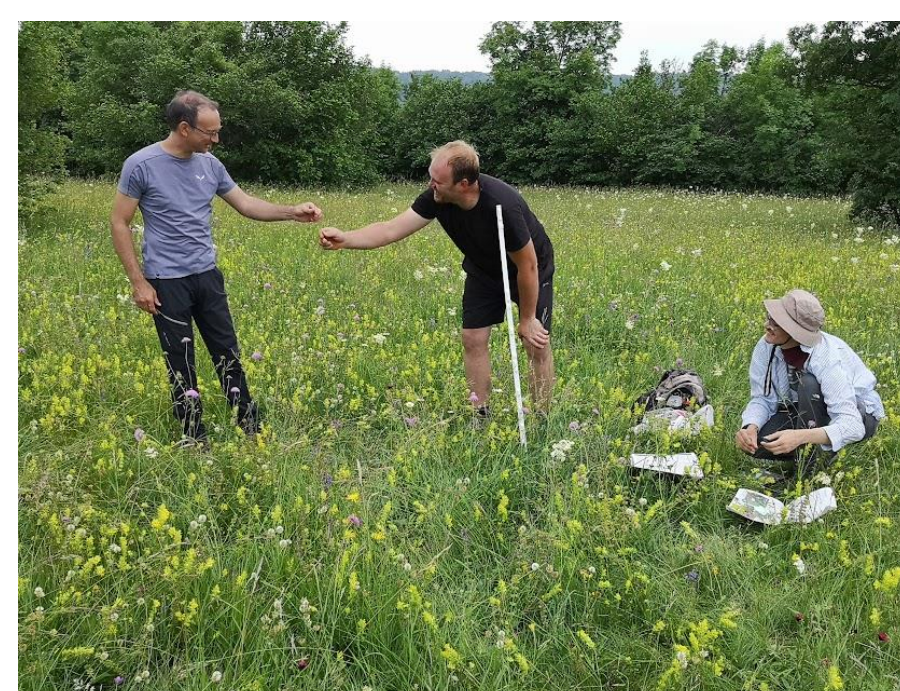
Fitocenološki popisi donorskih in recipientskih travnikov (primer iz Narina)