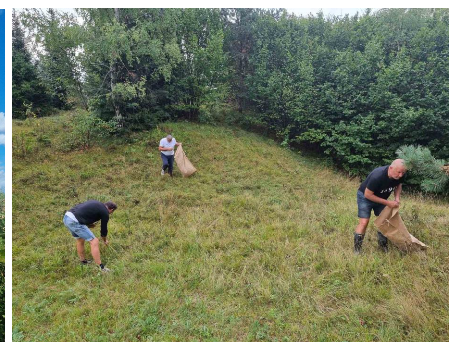
Poznopoletno nabiranje semen izbranih travniških rastlin (primer iz Zaplane)