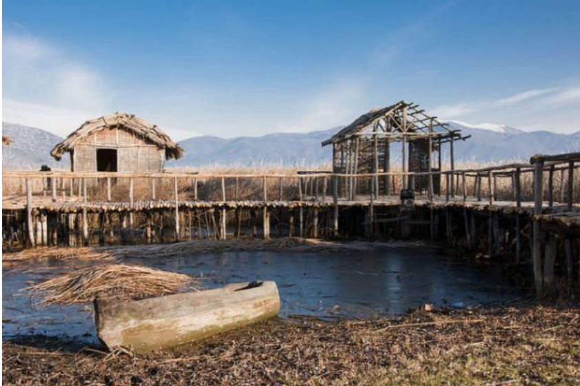
Koliščarji na Ljubljanskem barju so del zgodovine človeštva.

Ljubljanica, ta čarobna reka, ki nosi sedem imen, nas vabi, naj negujemo njeno zgodovino, naravne čudeže in izjemno kulturno bogastvo. Koliščarji, deblak in drevak, bujni gozdovi, medved, volk in ris, kristalni izviri Cerkniškega jezera, kmetovanje v nepredvidljivih razmerah, in voda, ki prinaša življenje. Vse to in še več je vezano na obstoj Ljubljanice in je del ne le slovenske, temveč tudi globalne naravne in kulturne dediščine.