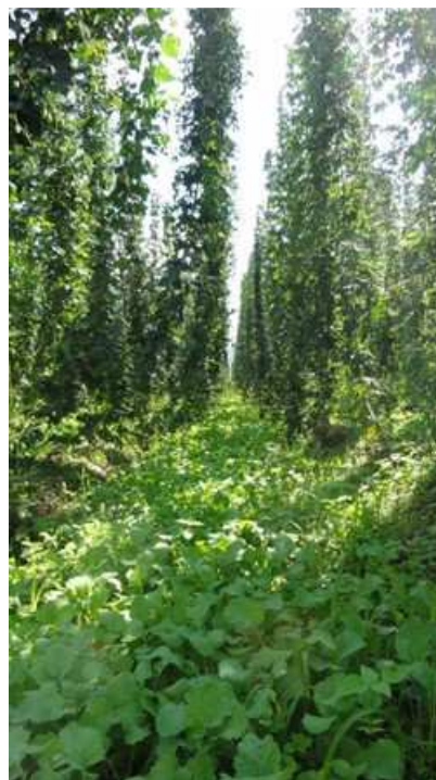
Slika 6: Dobro pokrit medvrstni prostor v avgustu, ko je hmelj še na njivi – manj bujen nasad