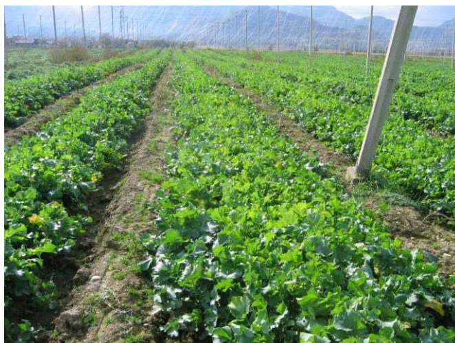
Slika 2: Po spravilu pridelka hmelja se podsevek razvija naprej, kar pozitivno vpliva na zmanjšanje zapleveljenosti in izpiranja hranil. Ko ga zaorjemo, ima pozitiven vpliv še na obogatitev tal z organsko snovjo in hranili.