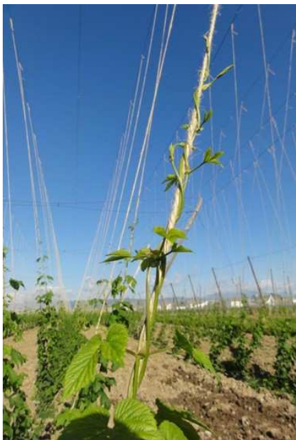
Slika 19: Vodilo juta 2200x2 je pleteno iz dveh vrvic. Potrebna je pozornost pri vezavi na konstrukcijo – da je čim trdneje navezано, kar omogoča, da ob vetru čim manj drsi po žici. Smiselno je tudi zavarovanje spodnjega dela vrvic pred gnitjem pred napeljavo (poskusi še v teku).

Namen izbirne zahteve HML_BIOV je s spodbujanjem uporabe biorazgradljivih vrvic za vodila za hmelj zmanjšati obremenitev okolja zaradi uporabe polipropilenske vrvice. V okviru te zahteve se namesto polipropilenskih vrvic uporabljajo hitro razgradljiva vodila – biorazgradljive vrvic.