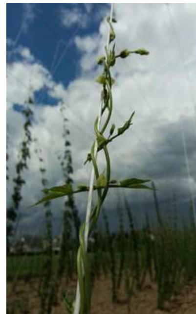
Slika 22: Vrvica iz polimerov škroba koruze (PLA) kot vodilo za hmelj mora imeti deklaracijo o biorazgradljivosti oziroma potrdilo, da se razgradi v kompostnem kupu (ang.: compostable) na naravne – neškodljive snovi.