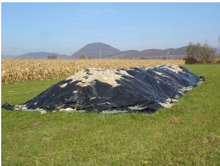
Slika 18: Kup hmeljevine se prekrije s PVC folijo, ki se jo ob robovih dobro pritisne ob tla.

Že pri izpadanju hmeljevine iz obiralnega stroja na prikolico ali pa pri postavitvi kompostnega kupa lahko vmešamo pripravke za hitrejše in boljše kompostiranje, ki niso okoljsko sporni.