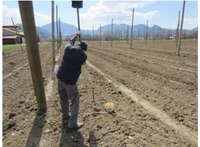
Slika 8: Sondo na vsakem odvzemnem mestu zabijemo v tla do globine 60 cm oziroma do kolikor tla dopuščajo.