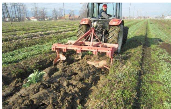
Slika 17: Zadelava hlevskega gnoja v hmeljišču