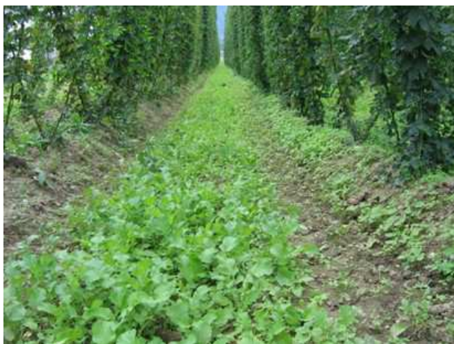
Slika 1: Medvrstni prostor je dobro pokrit že med rastno dobo hmelja, če je le-ta prvoleten ali slabše olistan. Sicer se v medvrstnem prostoru podsevek zaradi pomanjkanja svetlobe dobro razraste šele po spravilu hmelja v septembru.