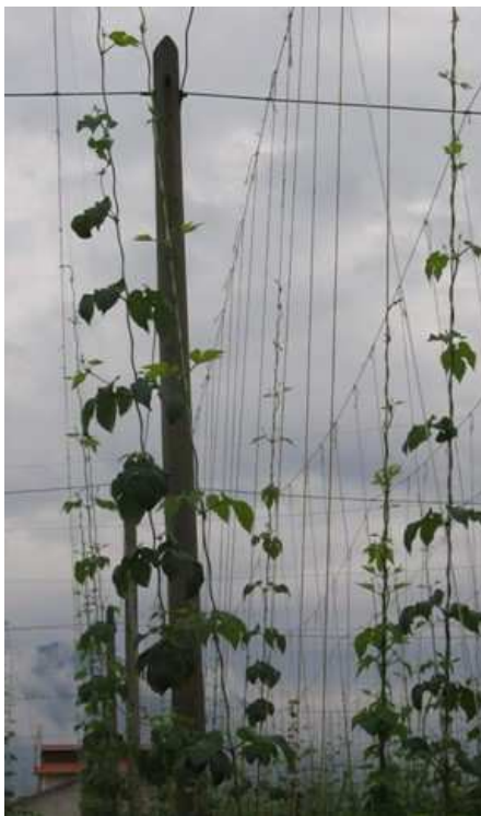
Slika 21: Vodilo iz kokosovih vlaken je dokaj robustno, v tleh med rastno sezono hmelja ne zgine, se ne trga, je pa bolj zamudna napeljava.