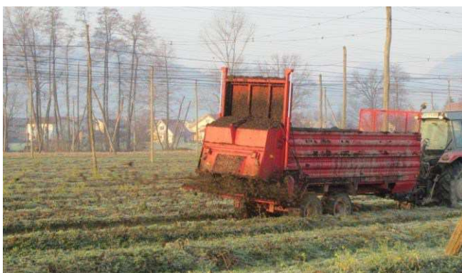
Slika 16: Raztros hlevskega gnoja