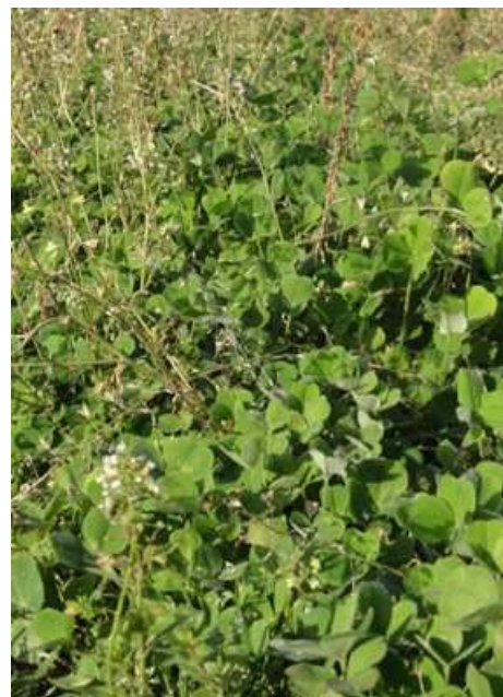
Slika 4: S setvijo podsevkov v hmeljišča zmanjšamo zapleveljenost.