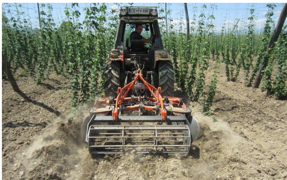
Slika 15: Zadelava gnojevke v hmeljišču