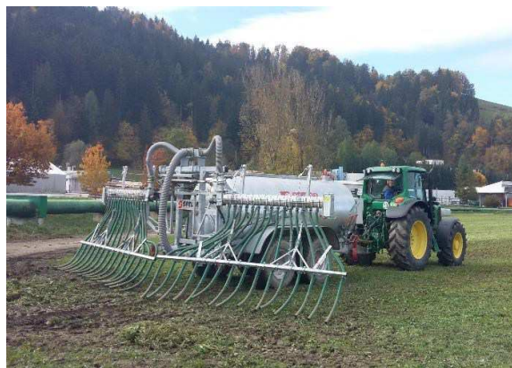
Slika 14: Način aplikacije gnojevke z vlečnimi cevmi na poljedelskih / travniških površinah – PRAVILNO