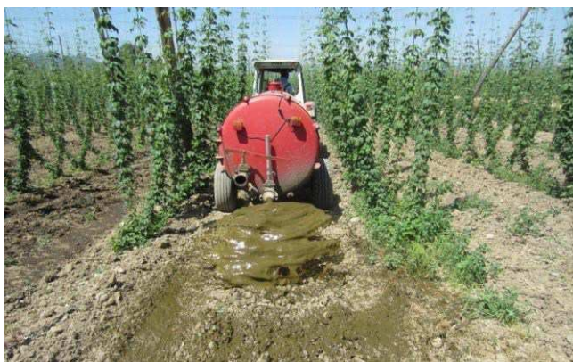
Slika 13: Način aplikacije gnojevke z razpršilnimi ploščami – NAPAČNO

Na KMG mora biti prisotna ustrezna mehanizacija ali shranjena pisna izjava izvajalca o opravljeni storitvi (priloga 2) ali shranjen račun za opravljeno storitev s strani izvajalca.