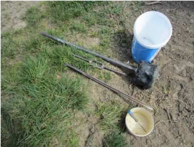
Slika 7: Za vzorčenje tal potrebujemo sondo z dovolj dolgo zarezo, kladivo, čisto vedro, strgalo, plastično vrečko in hladilno torbo.