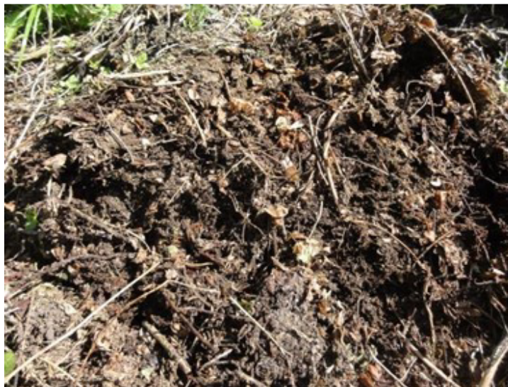
Slika 20: Vodilo iz jute se po nekaj mesecih po obiranju v kompostnem kupu popolnoma razgradi.

Višina plačila za izvajanje izbirne zahteve HML_BIOV znaša 158,10 eura/ha letno.