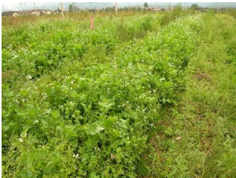
Slika 3: Pri cvetočih podsevkih moramo biti s časom setve previdni, da ne zacvetijo v rastni dobi hmelja; če se to vendarle zgodi, podsevek vsaj v delu hmeljišča, kjer je zacvetel, pred aplikacijo FFS zmulčimo. Potrebni so pregledi hmeljišča pred vsako aplikacijo.