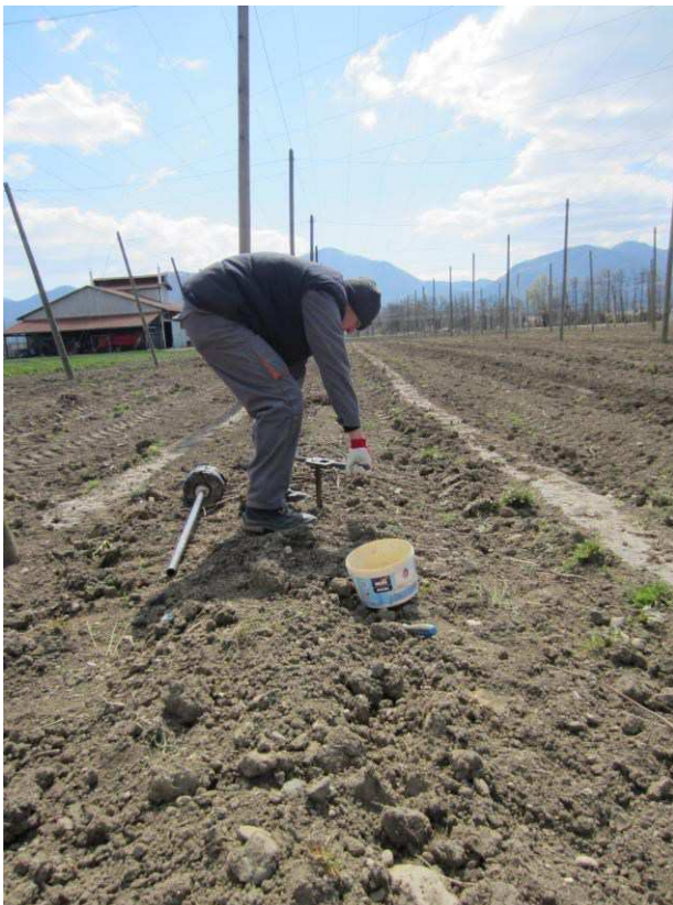
Slika 9: Ko sondo zabijemo v tla do želene globine, jo zavrtimo in previdno potegnemo iz tal.