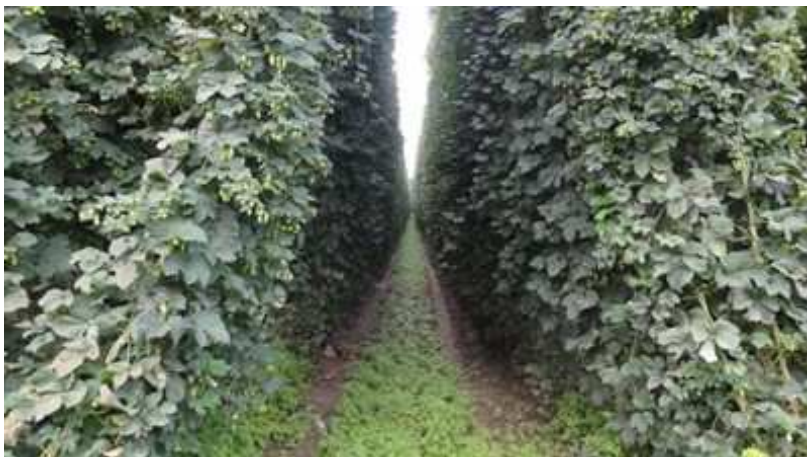
Slika 5: Dobro pokrit medvrstni prostor v času, ko je hmelj še na njivi – bujen nasad

Na slikah 5 in 6 sta podana primera dobre pokritosti medvrstnega prostora v času, ko je hmelj še na njivi, glede na to, kako bujen je nasad hmelja. Podsevek se lahko v bujnem nasadu razbohoti šele po obiranju hmelja, ko dobi dovolj svetlobe, kot je vidno na sliki 2.