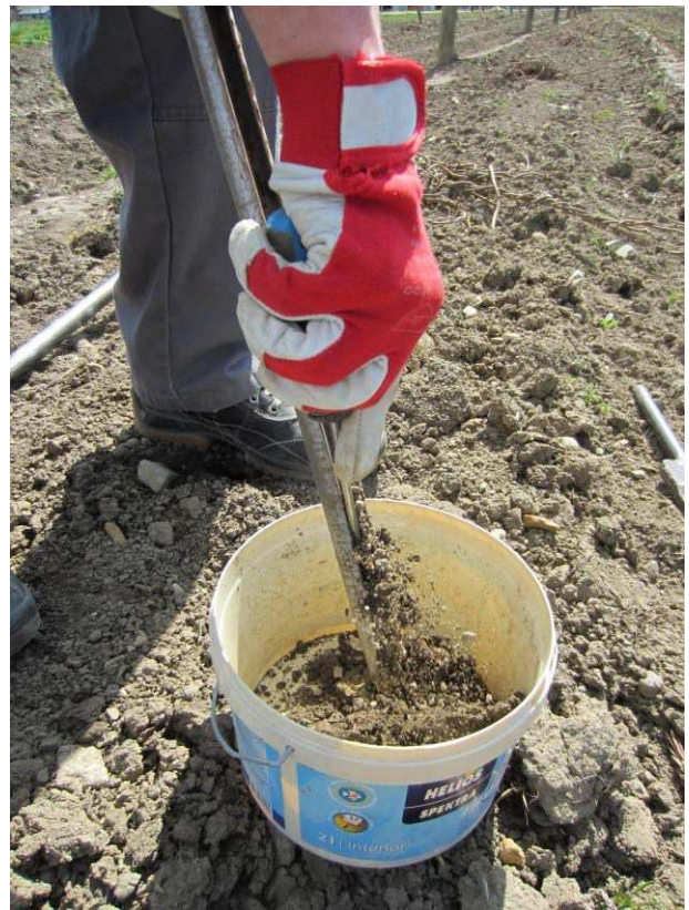
Slika 10: Vso zemljo iz sonde postrgamo v čisto vedro.

Ko vzamemo 20 do 25 podvzorcev, vso vsebino iz vedra spravimo v čisto vrečko in jo zavežemo. Vzorec damo takoj v hladilno torbo ali hladilnik in ga še isti dan v hladilni torbi odnesemo v laboratorij. Opremimo ga s podatki o lastniku hmeljišča, globini vzorčenja, zeleni analizi in zapišemo številko GERK_PID, s katerega smo vzorec vzeli (slika 11).