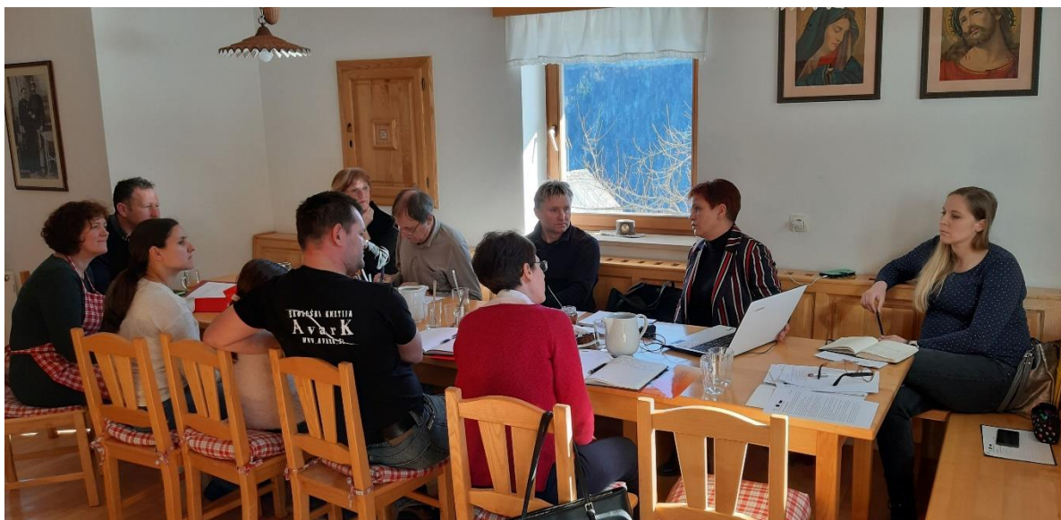
Slika 1: Začetno srečanje in usposabljanje partnerjev in sodelavcev projekta Na kmetijo!, Matkov kot, 30. januar 2020