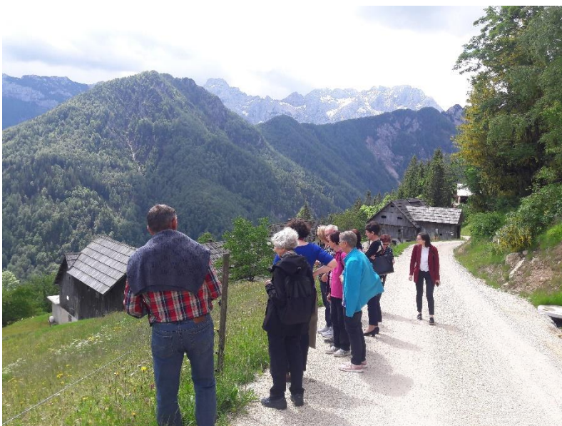
Slika 3: Na obisku kmetije Matk, 19. junij 2020

da bi objekt polovico leta (v zimskem času) sameval. Nastanitev starejših v zimskem času bi bila namreč logistično zahtevna zaradi potrebe po prevozih ter omejenih možnosti gibanja po okolici zaradi večje količine snega. Smiselno bi bilo starejšim ponuditi možnost bivanja med aprilom in oktobrom, v zimskem času pa namestitvene enote zapolniti s turisti za krajša obdobja. Vsekakor je v primeru kmetije Matk in podobnih kmetij potrebno prepoznati prednosti takšne kmetije za nastanitev starejših in te kvalitete tudi ustrezno ponuditi. Oblika druge družine za kmetijo Matk ni najboljša možnost nastanitve, saj skupine šestih stanovalcev ne bi mogli vključiti v obstoječe dejavnosti kmetije, bi pa lahko vzpostavili model kmetije v malem, kjer bi s skupino 12 stanovalcev ob pomoči referenčne osebe ponudili kvalitetno bivanje starejšim kot nekakšno počitniško nastanitev za nekaj poletnih mesecev. Ker je nastanitev za nekaj mesecev lahko nedosegljiva glede na finančne zmožnosti večine starejših, bi bilo dobro razmisliti o možnosti subvencioniranega bivanja (morda tudi s turističnimi boni) ali kakšni drugi obliki organiziranja, da bi kmetija lahko ob tej dejavnosti dobila dodaten dohodek, za starejše pa bi bile takšne ponudbe bolj dostopne kot klasične turistične namestitve.