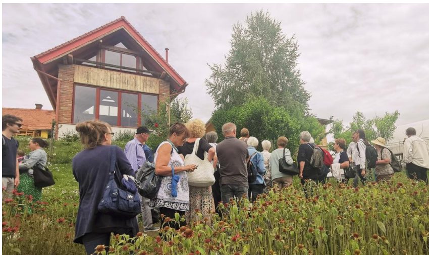
Slika 2: Oglad zeliščnega vrta na eko kmetiji Korenika v Šalovcih (partner Pribinovina), 2. julij 2021

preostalih dveh obiskih junija 2021 pa smo dali dodaten pogoj za udeležbo – PCT in vsi obiskovalci so imeli s seboj potrdilo o cepljenju, prebolelosti ali potrdilo o negativnem testu.