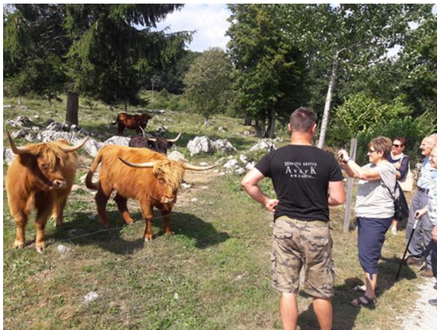
Slika 4: Obisk na kmetiji Avark, 29. avgust 2020

Dodana vrednost tovrstne oblike bivanja je predvsem v izboljšanju kakovosti življenja starejših, preživljanje časa v naravi, delo z rastlinami in živalmi pa dokazano vpliva tudi na izboljšanje psihofizičnega zdravja starejših. Za kmetije je dodana vrednost v dodatnem prihodku, večji prepoznavnosti in boljši povezanosti s širšo lokalno skupnostjo. Prav gotovo bi s tovrstno obliko bivanja okrepili tudi medgeneracijsko sodelovanje na kmetiji in v lokalni skupnosti.