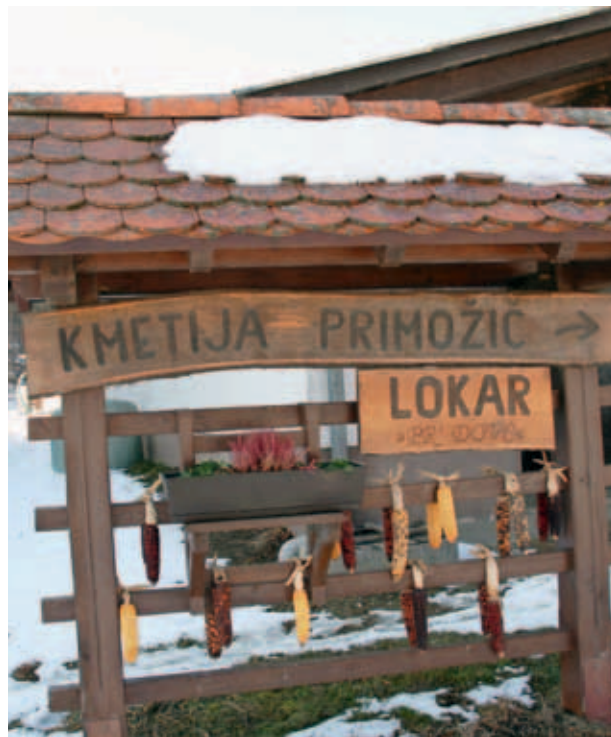
PRENOS KMETIJE VIDEN TUDI NA POZDRAVNI TABLI. (S.K.)