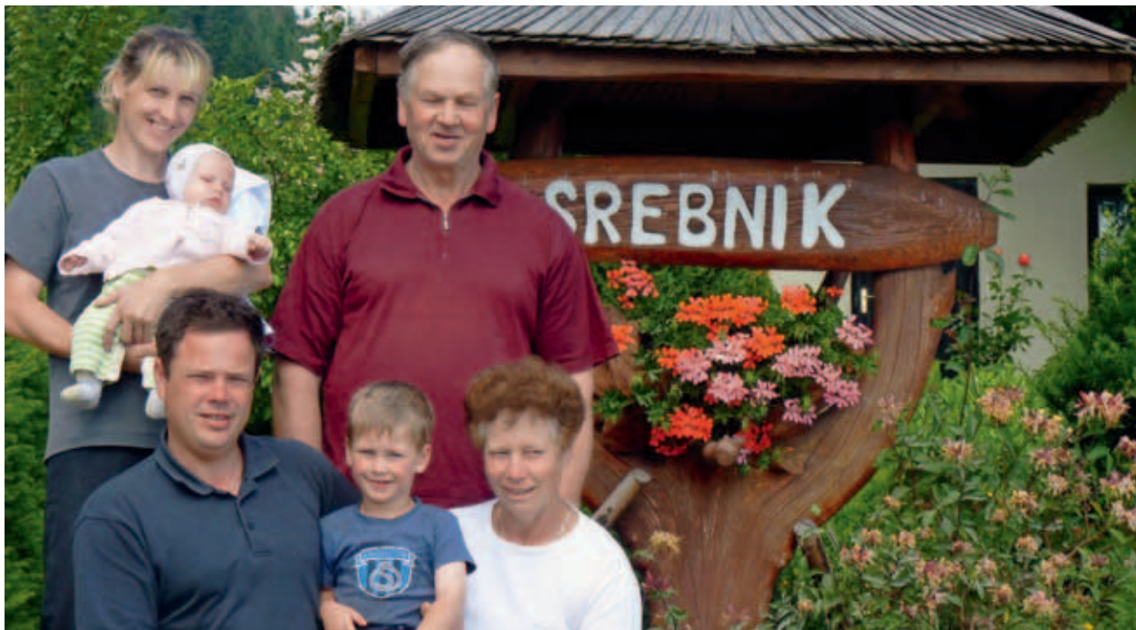
TRI GENERACIJE DRUŽINE PLIMON. (MKO)

Oba ukrepa sta pomembno prispevala k ohranjanju okolja, izboljšanju ekonomskega položaja