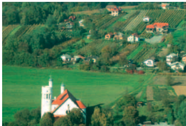
KMETIJA PUHAN SE NAHAJA V BLIŽINI PLEČNIKOVE CERKVE V BOGOJINI. (MKO)