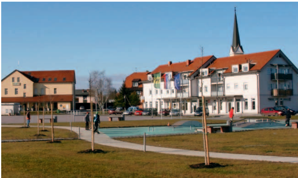
UREJENO VAŠKO JEDRO V KRIŽEVCIH. (S. K.)

Lično vaško jedro je urejeno v skladu s simboliko Prlekije: zelenice predstavljajo Mursko polje, poti ro-kave rek Mure in Ščavnice, fontana pa podtalnico. Tudi pri oblikovanju lesenih otroških igral za različne starosti so sledili lokalni dediščini kasaštva oziroma konjeništvu. Ureditev vaškega jedra je po mnenju domačinov pomembno izboljšala njihovo kakovost življenja (intenzivnejše medgeneracijsko druženje, aktivnejše preživljanje prostega časa).