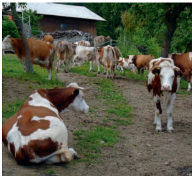
KRAVE V IZPUSTU PRED HLEVOM. (MKO)