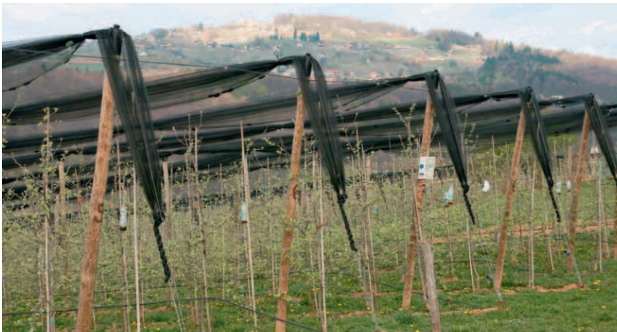
NASAD JABLAN S PROTITOČNO MREŽO IN NAMAKALNIM SISTEMOM. (S. K.)

Na ta način optimalno izrabljajo travniške in njivske površine. Z investicijo v nasad jablan pa so izboljšali delovne pogoje na kmetiji, povečali količino pridelanih jabolk ter posledično prihodek. S postavitvijo protitočne mreže in ureditvijo namakanja so zagotovili nemoteno kmetijsko pridelavo, zagotavljanje stalnega tržnega deleža in konstantne kakovosti pridelanih