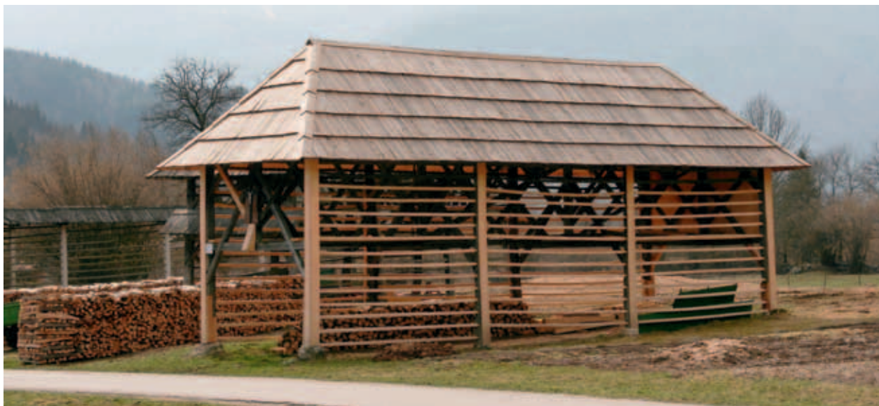
PRENOVLJEN KOZOLEC. (S. K.)

S prenovo se je življenjska doba kozolca, pomembne sestavine lokalne in nacionalne kulturne dediščine, podaljšala. Kozolec ostaja tudi za naslednje rodove dober primer uporabe lokalnega znanja in gradiv. Prav tako ostaja pomembna sestavina tamkajšnje kulturne krajine in turistična točka Triglavskega narodnega parka. Predvsem pa se je s prenovo ohranila njegova funkcija. Kozolec bo tudi v prihodnje lahko opravljal svoje osnovno poslanstvo – dosuševanje sena ter shranjevanje kmetijskih pridelkov in orodja.