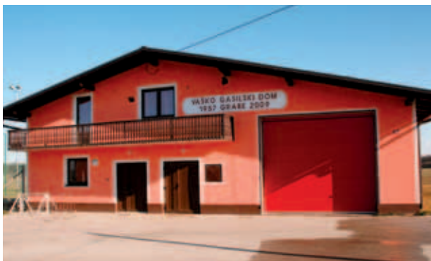
PRENOVLJENI VAŠKO-GASILSKI DOM V GRABAH.