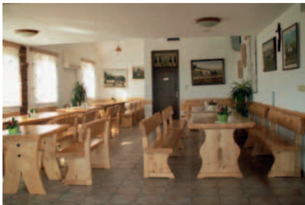
PROSTORI ZA GOSTE. (MKO)