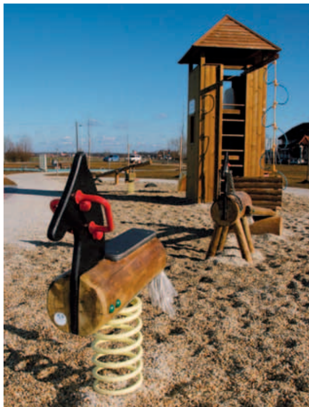
IGRALA V OBLIKI KONJEV. (S. K.)