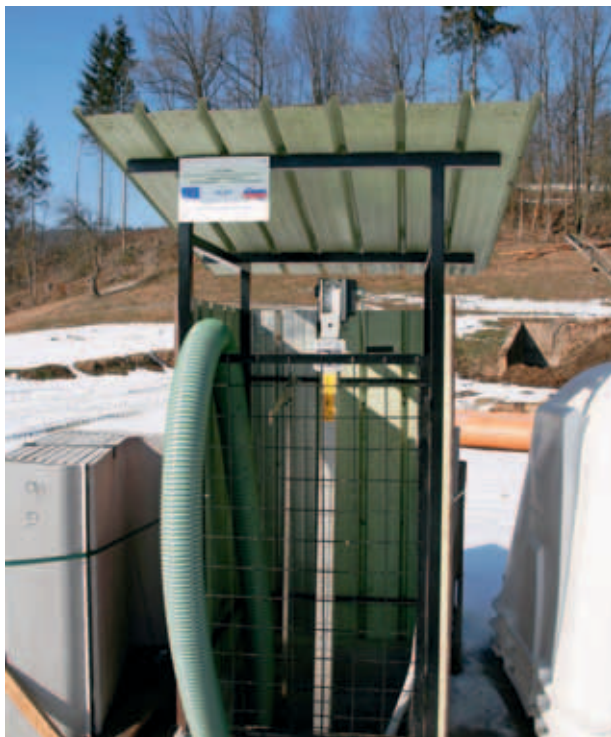
ZBIRALNIK ZA GNOJEVKO, POTOPNI MEŠALNIK IN ČRPALKA ZA GNOJEVKO. (S.K.)