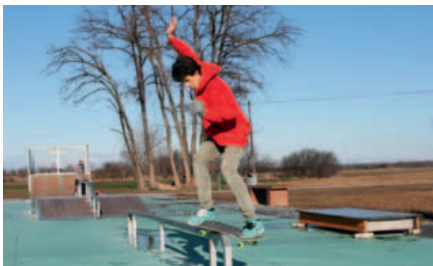
»SKATE« IGRIŠČE JE POMEMBEN PROSTOR ZA ŠPORTNE AKTIVNOSTI MLADIH. (S. K.)

V občini Križevci je 13 vaško-gasilskih domov, ki so središče bogatega družabnega in društvenega življenja vasi, saj v njih delujejo številna društva: gasilska, čebelarska, športna, kulturna itn. Osem domov je bilo potrebnih prenove, saj so bili dotrajani ter zdravju in okolju škodljivi.