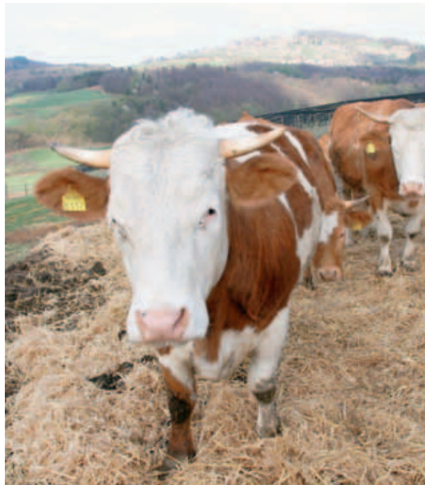
KRAVE V IZPUSTU. (S. K.)