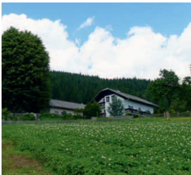
KMETIJA ŠREBNIK SE NAHAJA NA 1050 M NADMORSKE VIŠINE. (MKO)