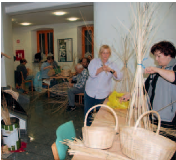
PLETARSKA DELAVNICA. (MKO)

Projekt je nosilec »LAS za razvoj« s pomočjo partnerjev izvajal med leti 2008 in 2011. Aktivnosti projekta so bile koordinacija in spremljanje, načrtovanje in priprava programa, vzpostavitev infrastrukture za izvedbo izobraževanj (obnova Podeželske hiše v Bovcu, oprema računalniške učilnice v Idriji) in njihova izvedba, priprava katalogov izobraževanj, promocija, evalvacija in priprava predlogov za nadaljnja izobraževanja.