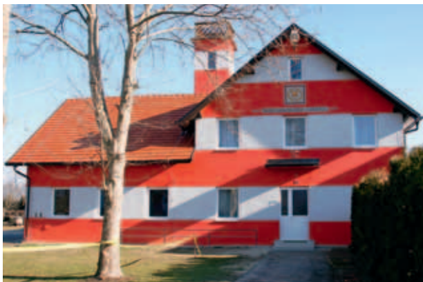
PRENOVLJENI VAŠKO-GASILSKI DOM V LUKAVCIH.