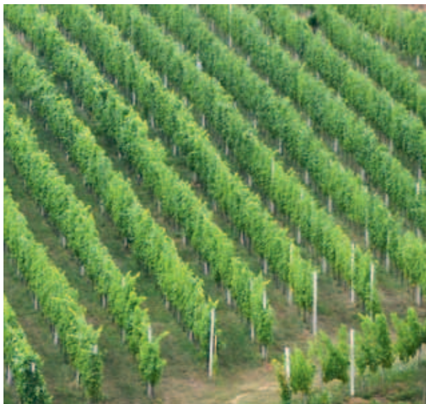
ŠTRMI VINOGRADI NA KMETIJI GRAMC. (MKO)