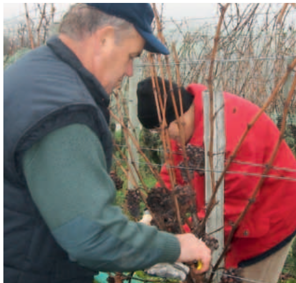
TRGATEV JAGODNEGA IZBORA. (MKO)