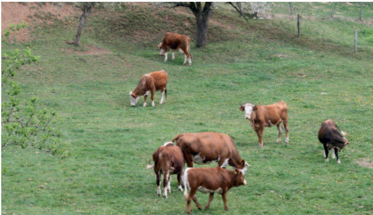
EKOLOŠKA REJA GOVEDI. (S. K.)

Na kmetiji dobijo iz ukrepa 214 – Kmetijsko okoljska plačila podporo za ekološko kmetovanje, integrirano vinogradništvo, košnjo strmih travnikov z nagibom 35–50 %, pridelavo avtohtonih in tradicionalnih sort kmetijskih rastlin (Žametna črnina, Kraljevina) ter strme vinograde z nagibom 30–40 %.