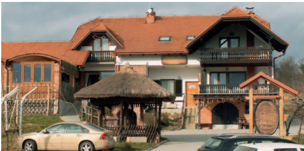
KMETIJA S TURISTIČNO DEJAVNOSTJO. (MKO)

V kleti imajo urejeno vinsko klet in prostor za pokušino vin redne in pozne trgatve. V ponudbo za turiste pa so vključili tudi sprehod med vinogradi kmetije, degustacijo vin in razgledni stolp nad kmetijo.