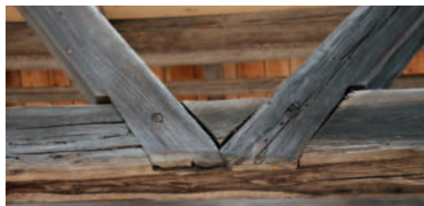
DELO BOHINJSKIH MOJSTROV. (S. K.)