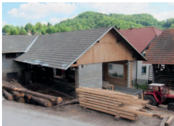
ŽAGA NA KMETIJI ŠPAN. (U. K.)