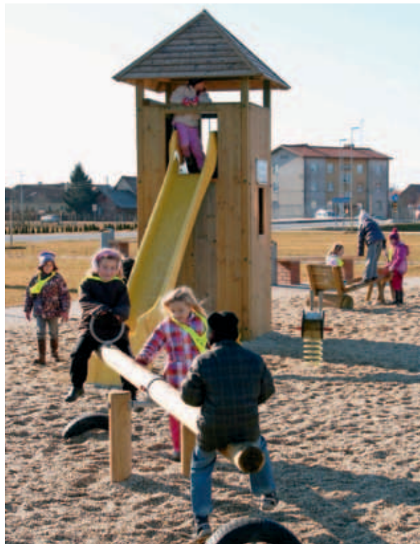
OTROCI PRI IGRI. (S. K.)

Obnova je imela številne pozitivne učinke na okolje, zdravje ter društveno in družabno življenje domačinov.