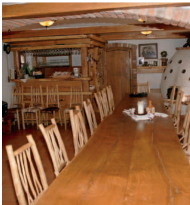
SOBA ZA GOSTE. (S. K.)