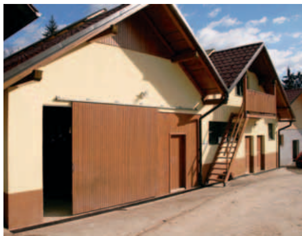
HLEV ZA KRAVE MOLZNICE. (S. K.)