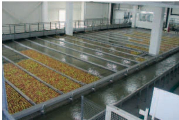
SORTIRNA LINIJA Z 21. VODNIMI KANALI.