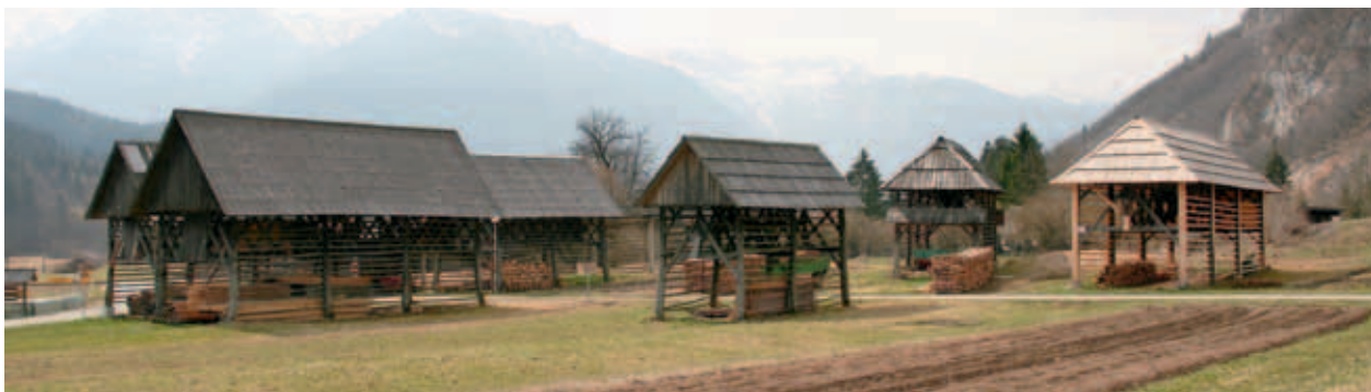
KOZOLCI V STUDORJU SO POMEMBEN ELEMENT KULTURNE KRAJINE. (S. K.)