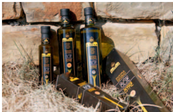
IZDELKI SKUPINE PROIZVAJALCEV EDOOSI.