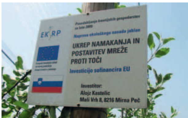
OZNAČEVALNA TABLA. (S. K.)