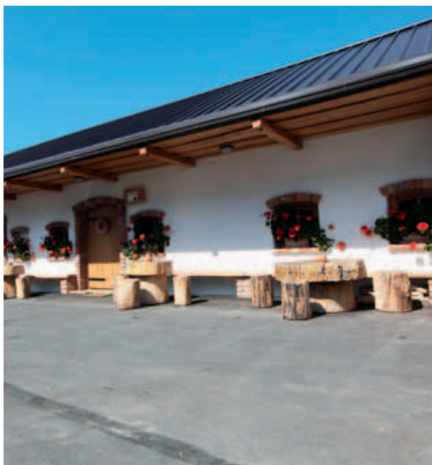
PROSTOR ZA SPREJEM GOSTOV. (MKO)