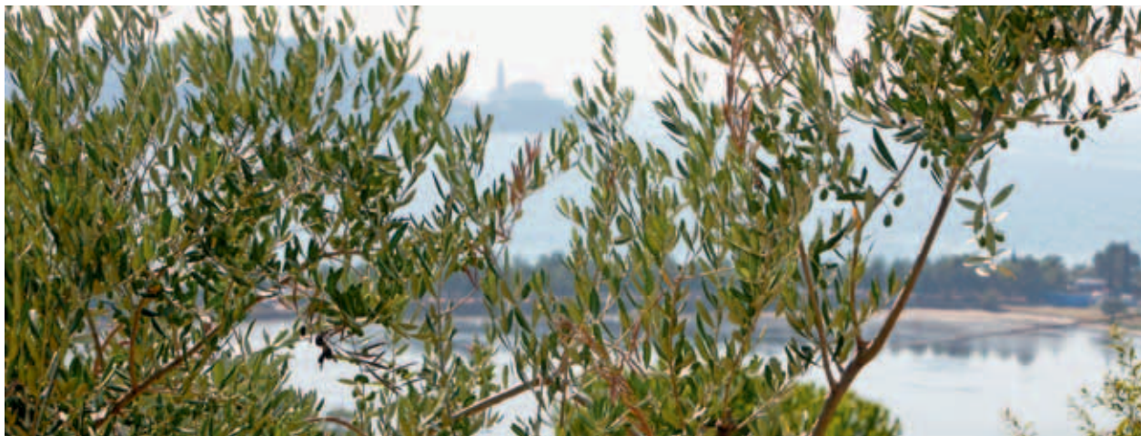
OLJKE V SLOVENSKEI ISTRI. (MKO)

Ekstra deviško oljčno olje slovenske Istre je prvi slovenski kmetijski pridelek, vpisan v register zaščitene oznake porekla in zaščitene geografske oznake v Evropski uniji. Evropsko priznana zaščita