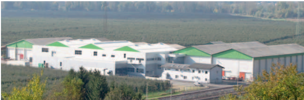
HLADILNO-SORTIRNO-PAKIRNI CENTER (HSPC) EVROSAD MED SADOVNJAKI. (MKO)

V pakirnici deluje 5 linij za pakiranje sadja, katerih skupna kapaciteta je 16 t/h. Omogočajo avtomatsko