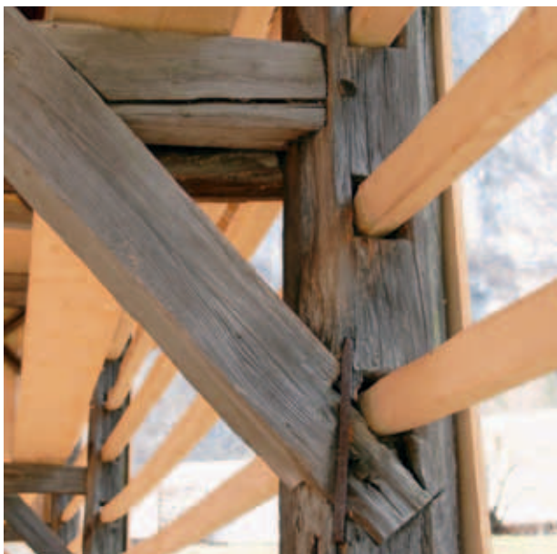
DETAJLI PRENOVLJENEGA KOZOLCA. (S. K.)