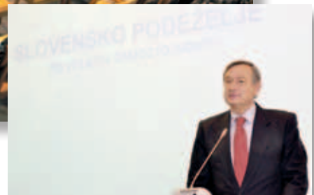
PRVO ZASEDANJE SLOVENSKEGA PODEŽELSKEGA PARLAMENTA JESEN 2011. (MKO)